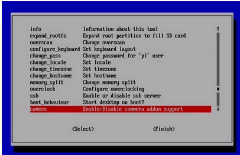
图 2. 启用树莓派摄像头