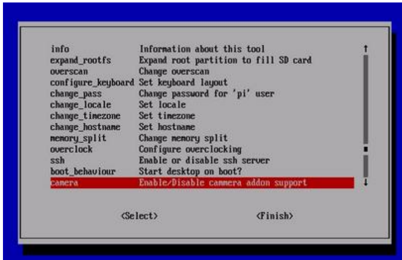
图 2. 启用树莓派摄像头